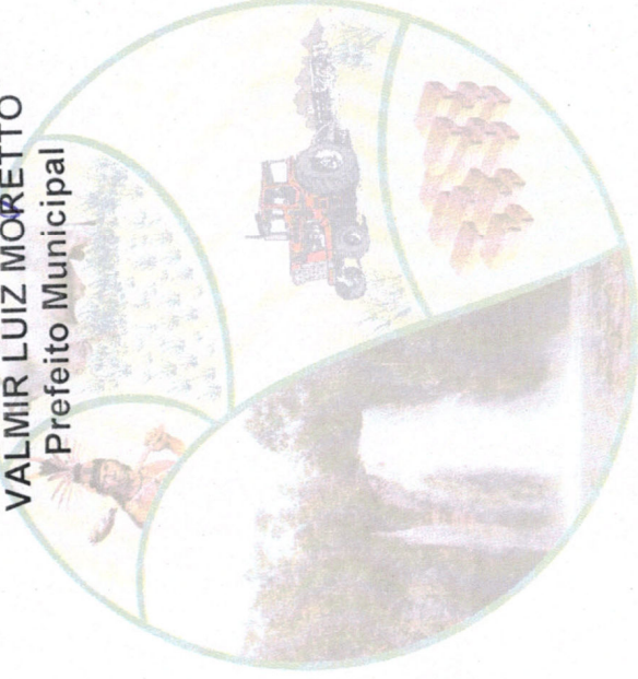
VALMIR LUIZ MORETTO Prefeito Municipal