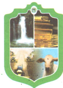
UILSON JOSÉ DA SILVA PREFEITO MUNICIPAL

Gabinete do Prefeito do Município de Nova Lacerda-MT, 23 de abril de 2024.